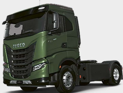
IVECO X-WAY Modell AS440X46T/P CNG ON+ - EG4T

Sehr geehrte Damen und Herren, vielen Dank für Ihr Interesse an einem Fahrzeug aus der umfangreichen Iveco Produktpalette. Unter Zugrundelegung der allgemeinen Geschäftsbedingungen der Iveco Magirus AG bieten wir Ihnen freibleibend das folgende Fahrzeug an.